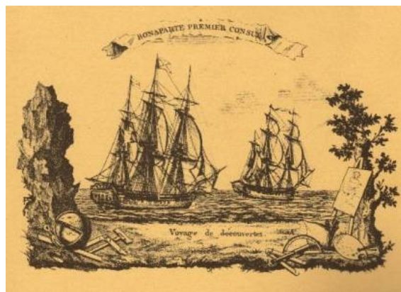
Bonaparte I er Consul - voyage de découverte

Il meurt le 16 janvier 1864, aux termes de grandioses funérailles, il est inhumé aux Invalides.