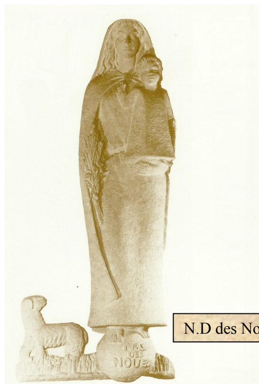
N.D des Noues

Le nom de Notre Dame rappelle, selon le vœu de Louis XIII de consacrer la vierge Marie, patronne et protectrice de la France, à la naissance tant attendue de son héritier, futur Louis XIV en 1638. Les Noues, vieux mots français qui signifiaient des terres marécageuses et nous rappellent qu'ici, au IX e siècle, des moines venus de l'abbaye de Saint Denis les ont asséchées et rendues cultivables.