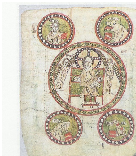
Le Christ et ses quatre Évangélistes

La plus grosse cloche pèse 250Kg, elle donne le do, sa devise est « la Foi », nom de baptême : Mauricette Jeanne.