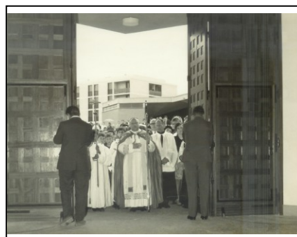
Première messe 7 juillet 1968