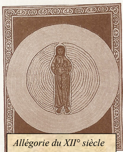
Allégorie du XII e siècle

Le carré est lié à la symbolique du nombre quatre représentant le concret, le nombre trois étant lié au spirituel.