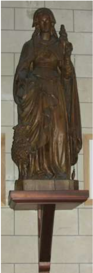
Sainte Geneviève (J)