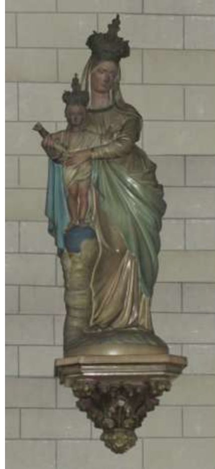
La Vierge présentant l'Enfant-Jésus (C)