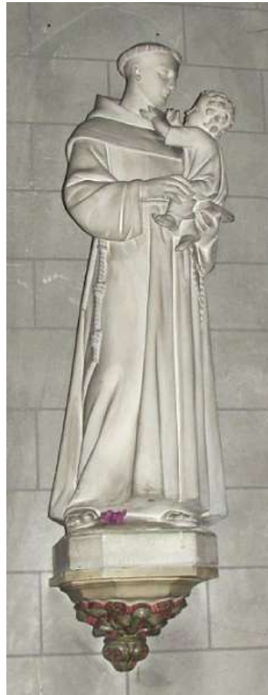
St Antoine de Padoue (G)