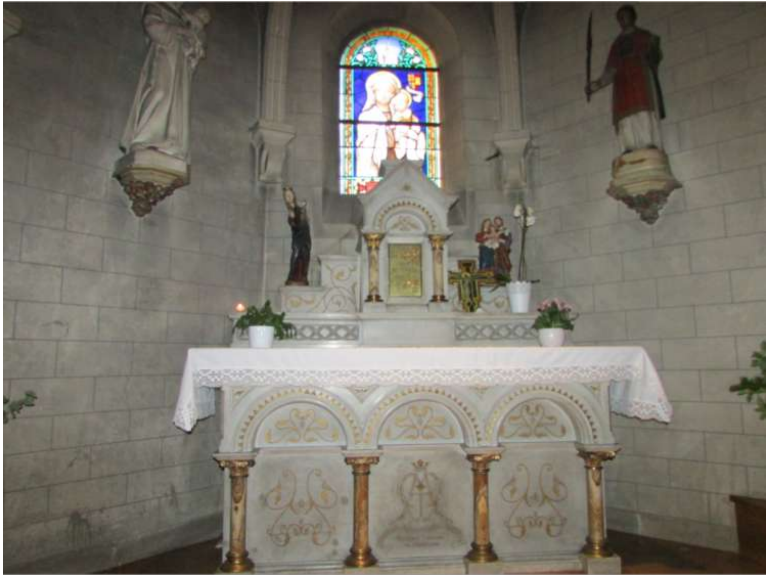
La Chapelle (derrière l'orgue)