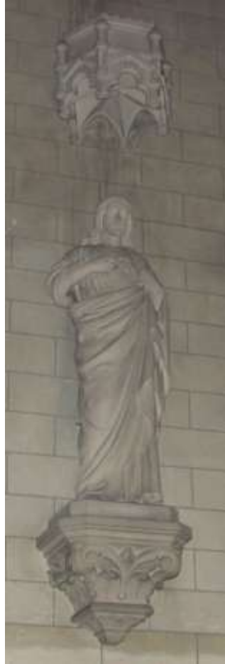
Le Christ (B)