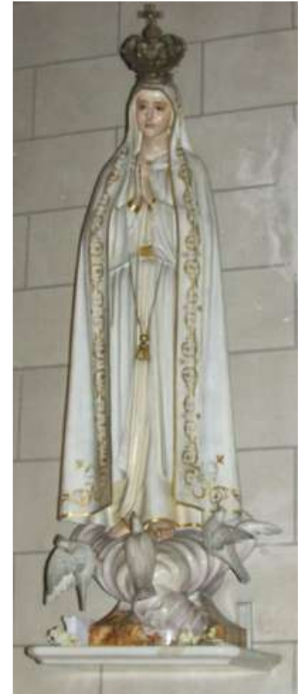
Notre Dame de Fatima, installée en 1985 (I)

Les statues de la chapelle de la Vierge de gauche à droite,