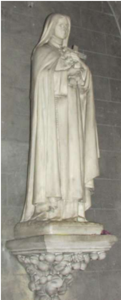
Sainte Thérèse de l'enfant Jésus (F)