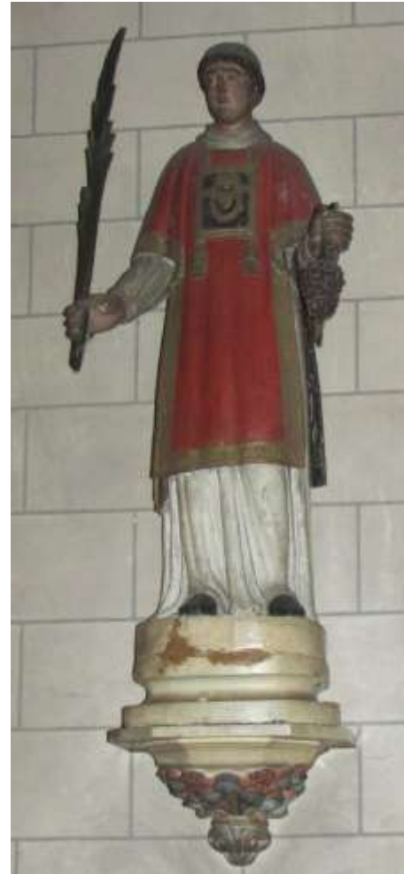
Saint Vincent du XVIIIe, patron des vigneron (H)